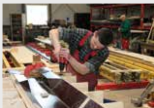
Hala pierwomontaży PERI