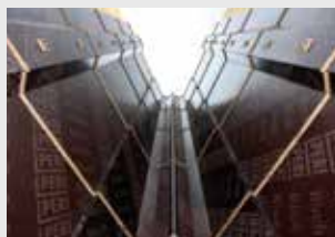
Deskowanie słupa V