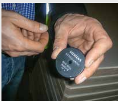
Tagi RFID: każdy tag ma przypisany unikatowy numer, który jednoznacznie identyfikuje białe.