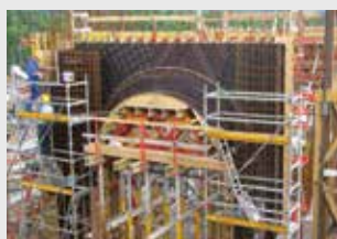
Deskowanie formy łukowej