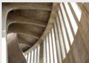
Świątynia Opatrzności Bożej, Warszawa

Sklejka PERI pozwała spełnić ambitne oczekiwania projektowe