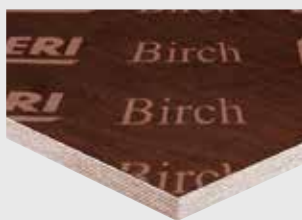
Sklejka PERI Birch