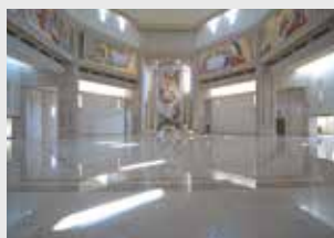
Centrum Jana Pawła II, Kraków