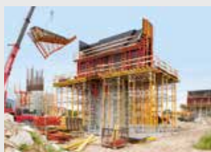
Deskowanie podpory estakady