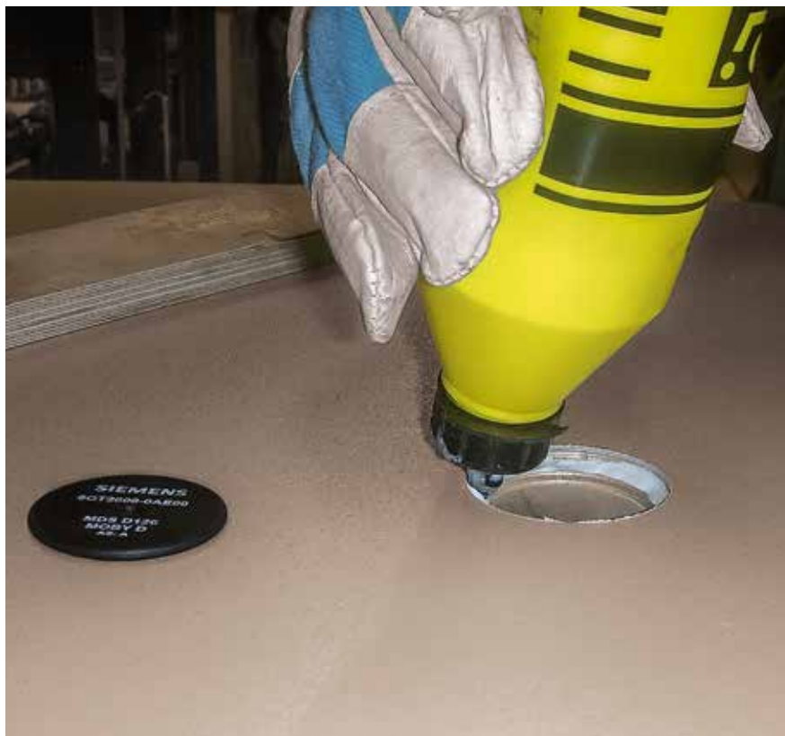
Wbudowanie chipów w białe PERI Pave można przeprowadzić w każdej chwili za pomocą zestawu naprawczego.

W ten sposób tworzy się informacyjne połączenie pomiędzy stroną mokrą i suchą, co daje możliwość transparentnego monitorowania produkcji.