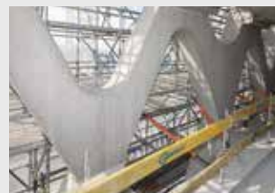
Elewacja Prosta Tower